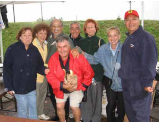
L'associazione fu rappresentata da diversi Consiglieri accompagnati dalle loro consorti.

Anche quest'anno la nostra Associazione rappresentò gli italiani alla Giornata Culturale di Dollard des Ormeaux. Oltre a parecchi Consiglieri, partecipò pure il gruppo folcloristico "Le Spighe" che eseguì danze tradizionali del Molise.