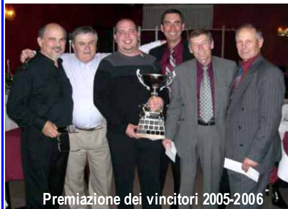
Premiazione dei vincitori 2005-2006