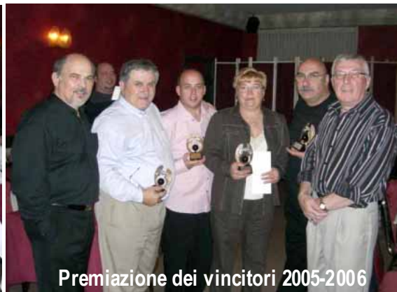
Premiazione dei vincitori 2005-2006