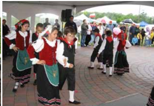
Le Spighe, gruppo folcloristico del Molise, eseguì danze tradizionali.