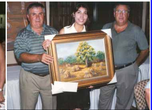
La vincitrice del sorteggio